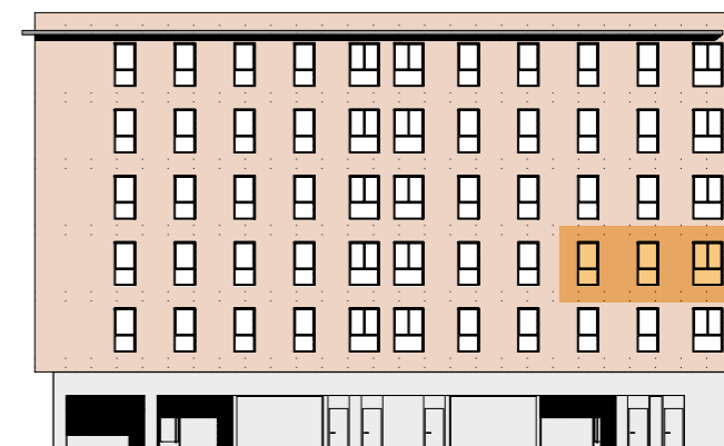
Portal 2. Planta 2ª izquierda. Alzado norte