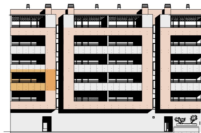
Portal 2. Planta 2ª izquierda. Alzado sur